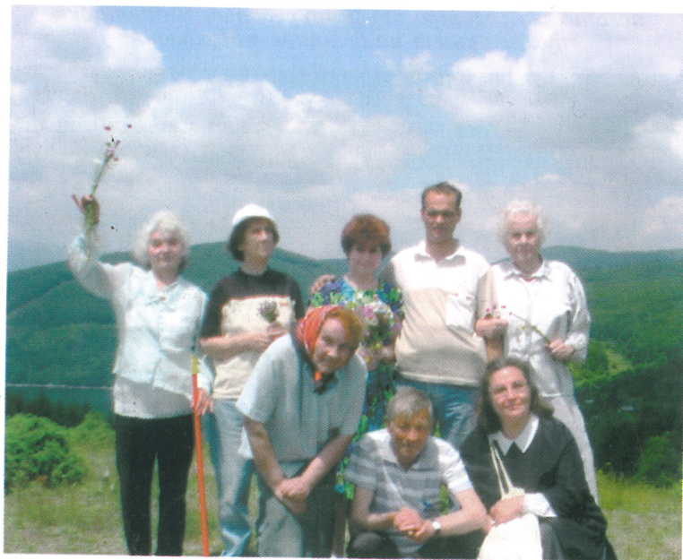
Незабавим ден в планината над с. Пасарел. Част от групата на приятели бахаи и християни