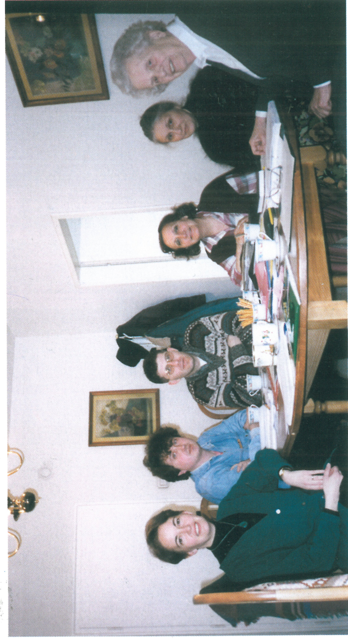
С няколко бахайски приятели от Националния духовен съвет в новия бахайски център в София на ул. „Боянски възход“ 8а